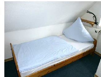
Zwei Schlafzimmer mit insges. 3 Betten? Was stimmt denn jetzt?