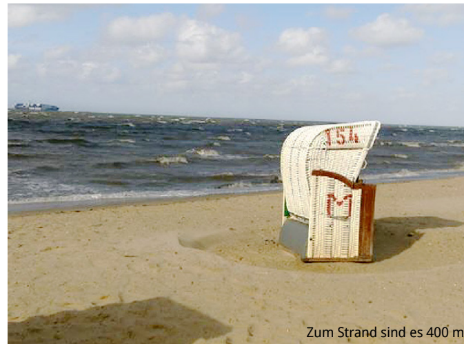
Zum Strand sind es 400 m!

Am besten erreichen Sie das Ferienhaus mit dem Pkw. Eine Anreise mit Bahn oder Flugzeug ist ebenfalls möglich: Sie fahren bzw. fliegen bis Hamburg oder Bremen und nehmen von dort den Regionalzug nach Cuxhaven. Sie erreichen das Haus bequem mit der Buslinie 1: Sie steigen an der Haltestelle „Steinmarne“ aus und kommen über den Neptunweg direkt in den Poseidonweg.