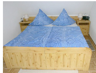
Ein Schlafzimmer mit Doppelbett

Das Haus hat außerdem einen schönen ruhigen Garten mit einer überdachten Terrasse, auf der Sie wunderbar entspannen können. Dort finden Sie auch den Grill, einen Fischbrat-Herd und weiteres Strandequipment. Außerdem gibt es ein kostenloses Brötchen-Hol-Fahrrad!