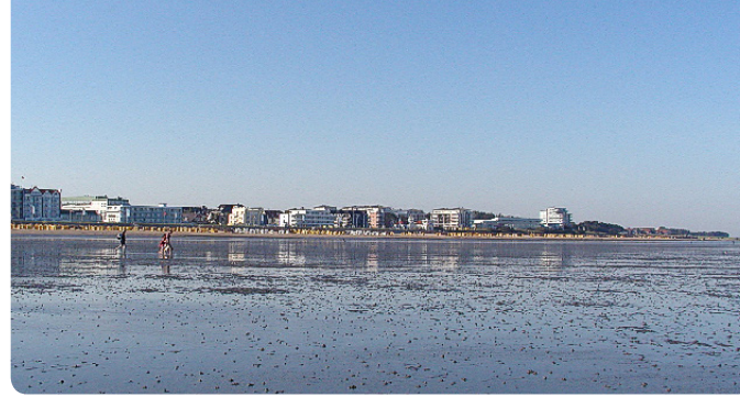
Blick auf Cuxhaven